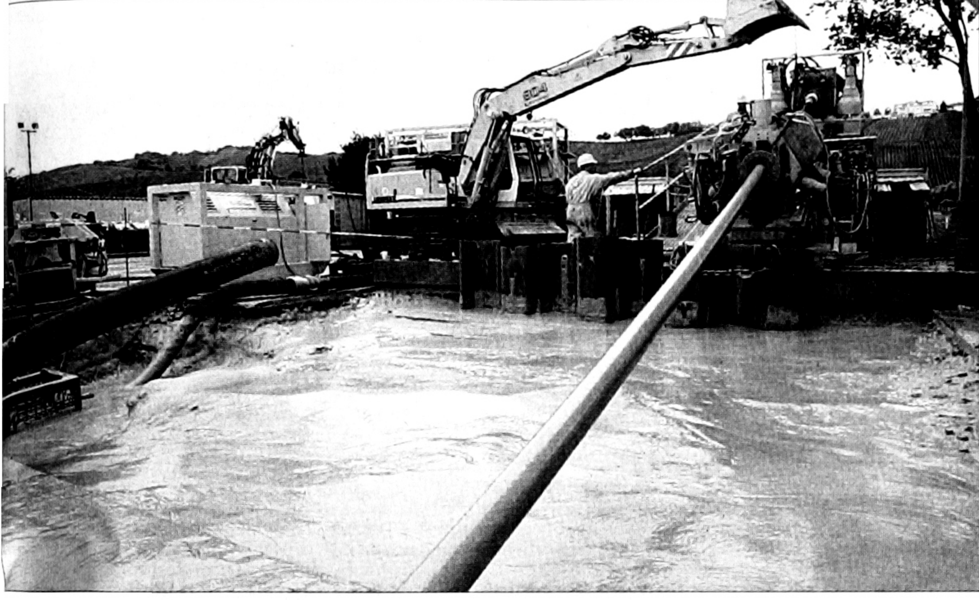
Gestern wurden die Bohrungen zur Unterquerung der Mosel abgeschlossen

Die Gesamtinvestition liegt bei 300 Millionen F.