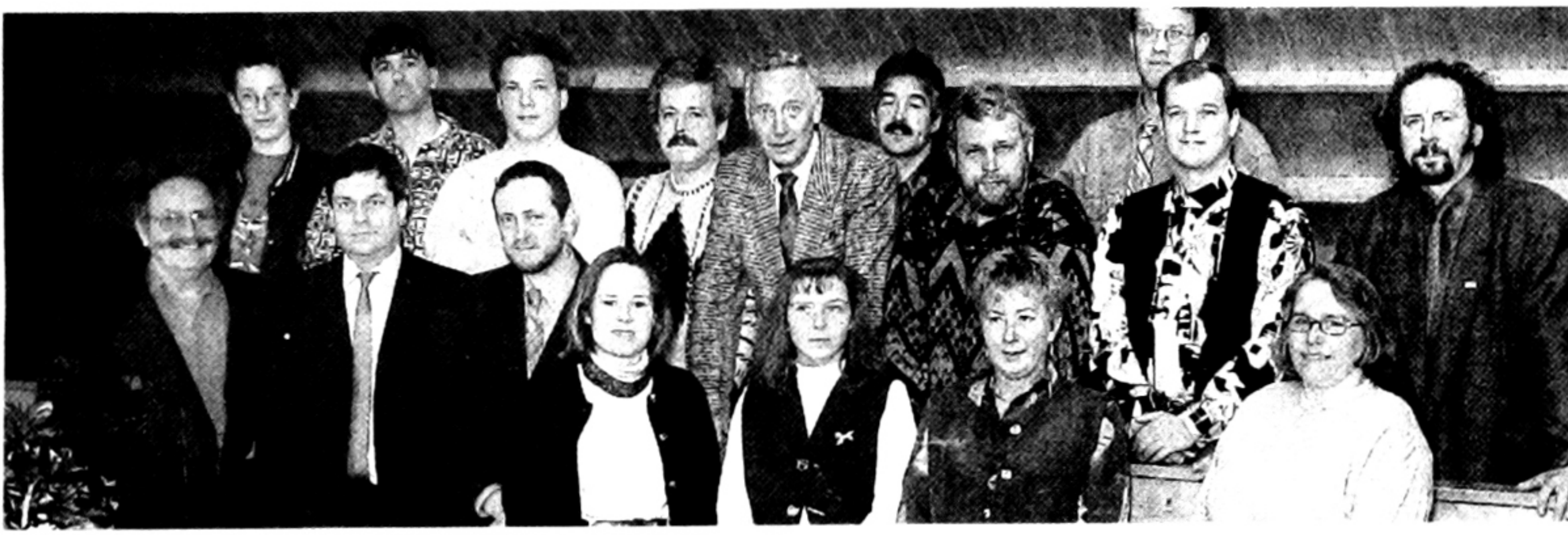
Erste-Hilfe-Kursus in Nommern abgeschlossen

Schiren. - D'Schirener Jugend invitéiert Iech op hir Theaterowender. Gespillt gëtt den 1. an den 2. Abrell am Festsall. Um Programm steet: „Playboy, Autostop a Milliounen“, e leschtgen Draakter vu Josy Christen.